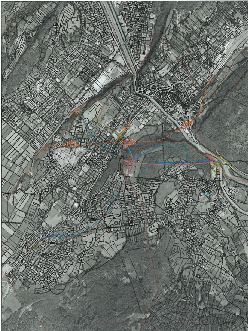
Abbildung 1: Skizzierung des Verlaufs einer potentiellen Südeinfahrt Feldkirch gem. mit dem Stadttunnel Feldkirch.

Die Höhenlage und der Streckenverlauf einer neuen Bahn-Südeinfahrt sind nur schematisch dargestellt; berücksichtigen aber die Lage des Stadttunnel Feldkirch, damit die Projekte sich nicht gegenseitig ausschließen. Verlauf und Trasse der Südeinfahrt sind in oranger Farbe dargestellt mit möglichen unterirdischen Haltestellenbereichen (oval).